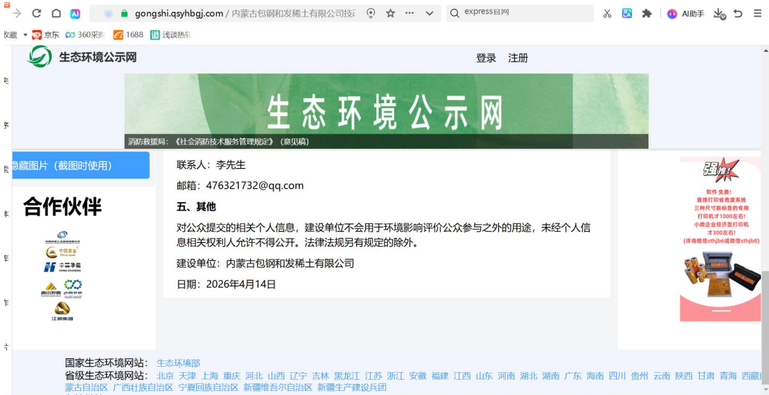
附图 2 二次信息公开网站截图