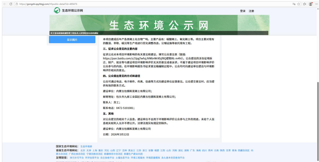
附图1 首次信息公开网站截图